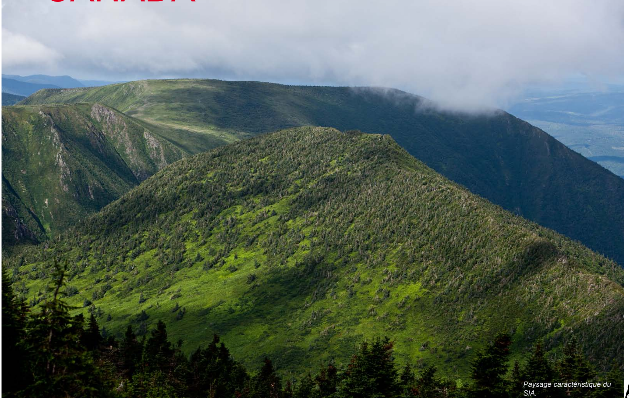
Paysage caractéristique du SIA.

Sentier International des Appalaches Photographies et texte Laurent Boiveau