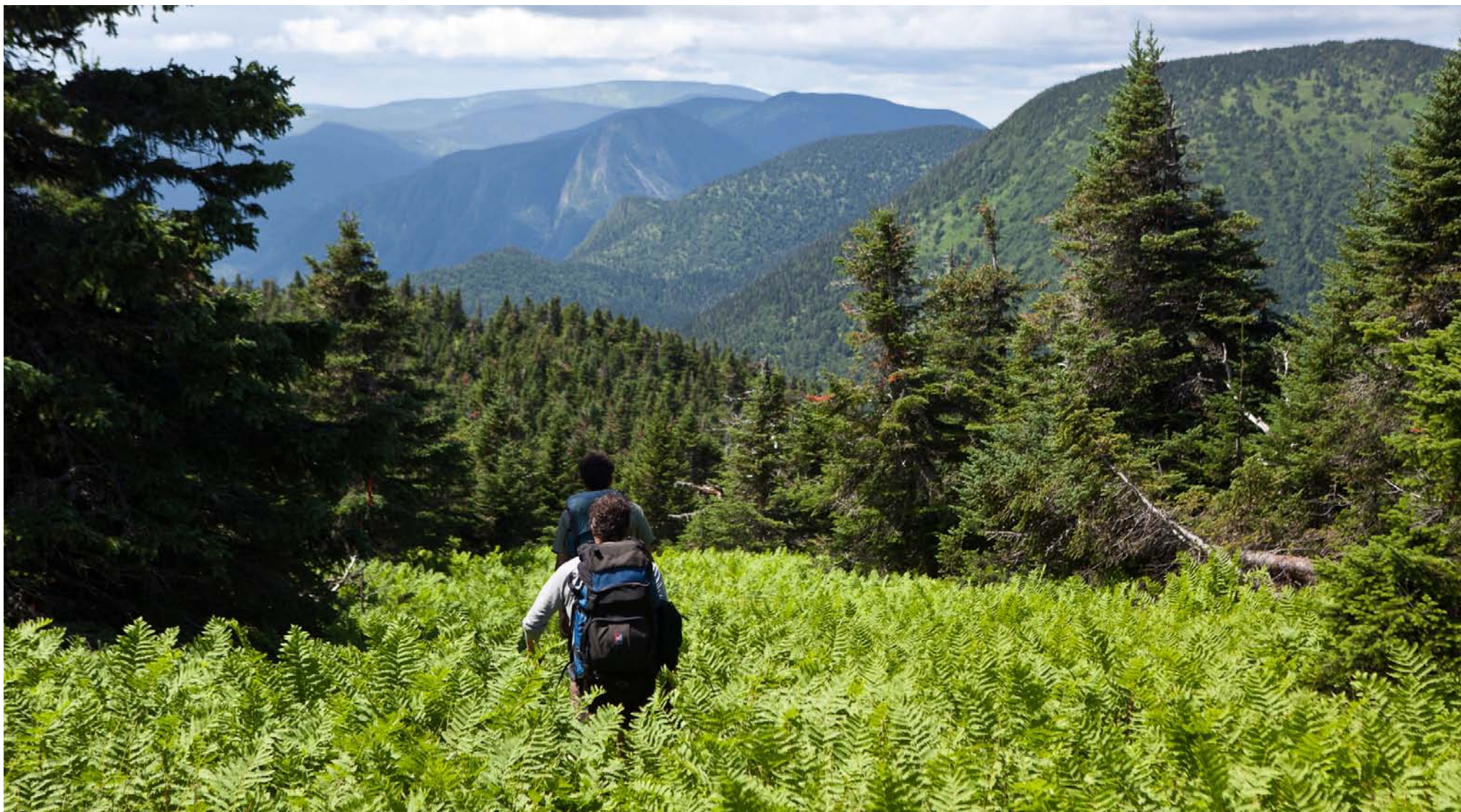
Le vert tendre des fougères, dans une «Mer de Montagnes»

facilement. Elle prend le temps d'attirer l'attention sur elle pour laisser à sa progéniture le temps de se réfugier sous le couvert de la végétation. Partant et revenant vers vous, elle laisse aux poussins le temps de se dissimuler dans la végétation. Puis une fois tout le monde à l'abri, elle finit par se percher sur une branche haute, mimétisme parfait se fondant dans le décor tant son plumage rappelle l'écorce des résineux.