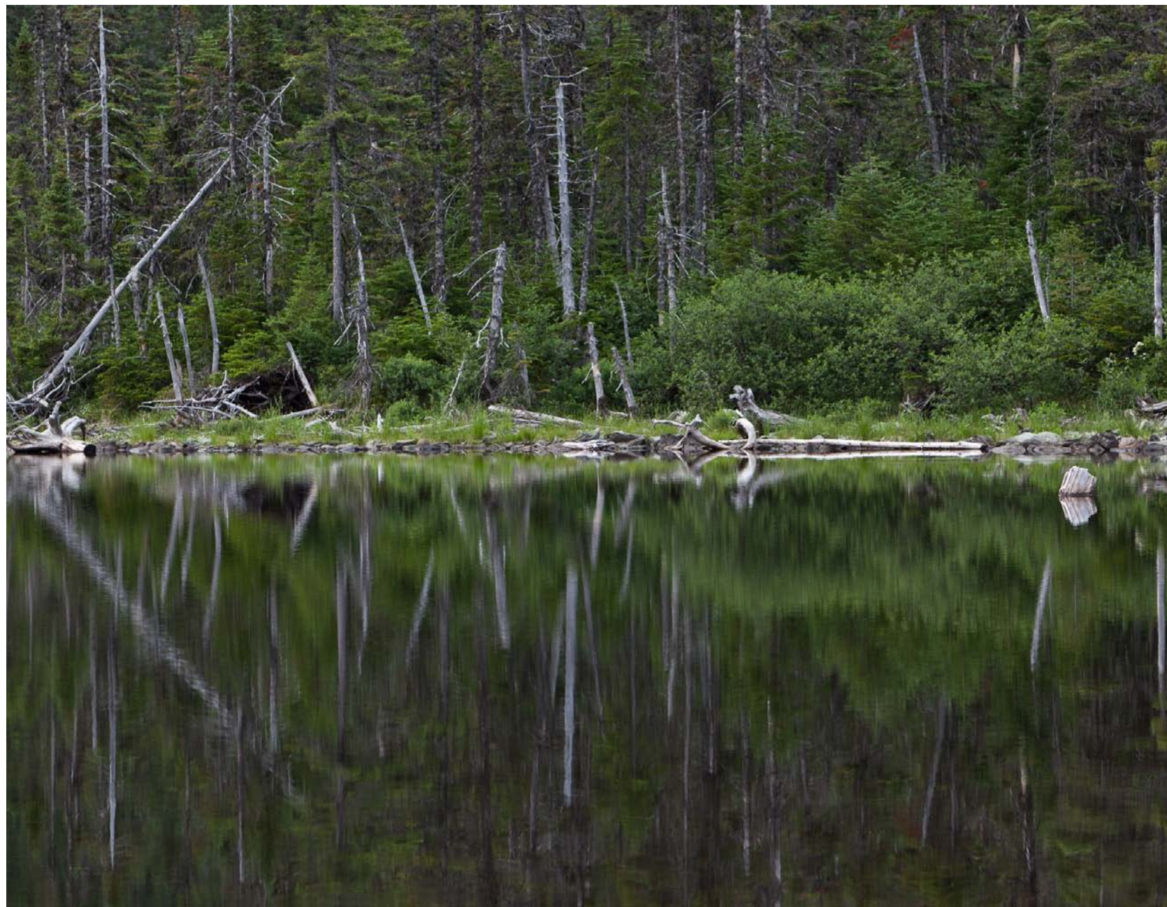
Lac Beaulieu au petit matin

Le tracé n'épargne aucune zone remarquable, mais en contrepartie il demande une certaine implication. Tout d'abord il faut être en autonomie complète, sans ravitaillement possible. Le poids du sac en prend un coup. Les belles grimpettes se transforment rapidement en im-