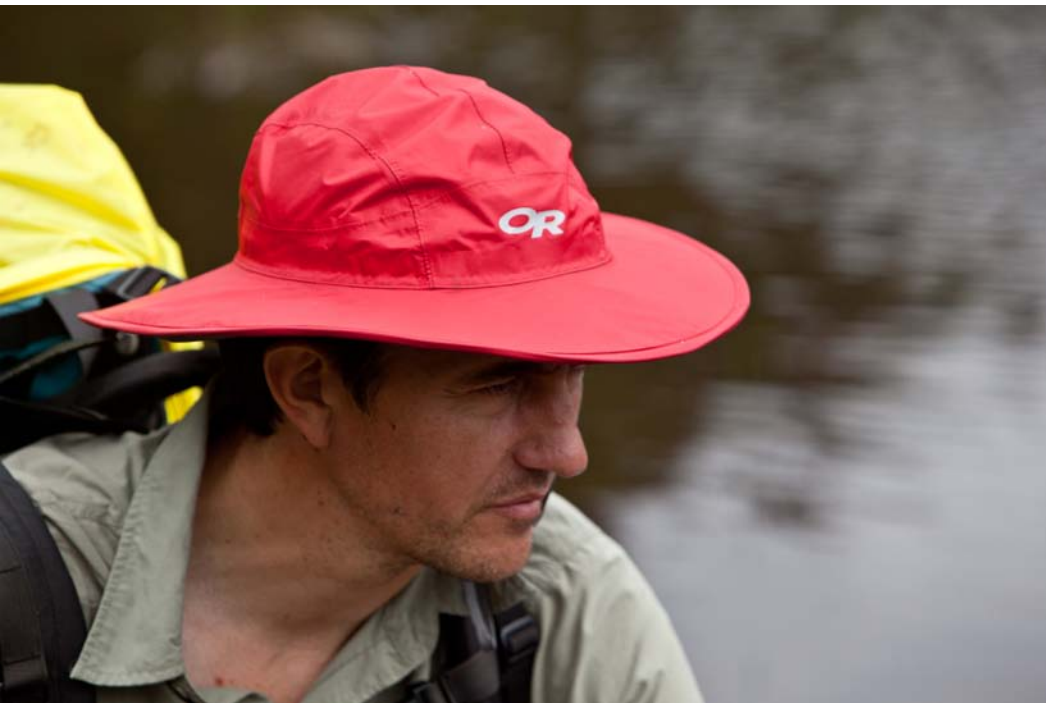
Gaspésie, pays des lacs, paradis des pêcheurs