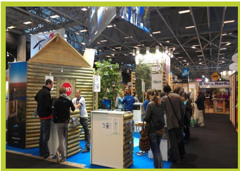
Kiosque du Québec à Paris