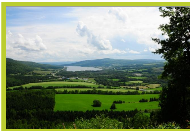
Vallée de la Matapédia