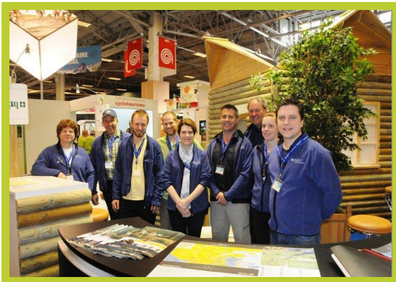
Exposants du Québec présents à Paris