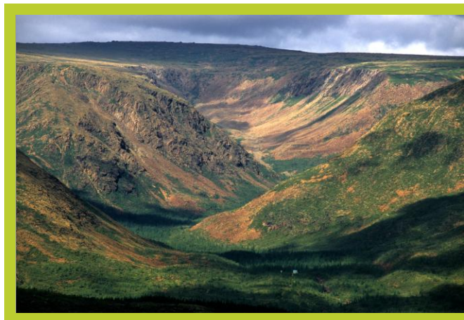
Cuve du Diable

Lien vers la page d'accueil : http://www.sia-iat.com/